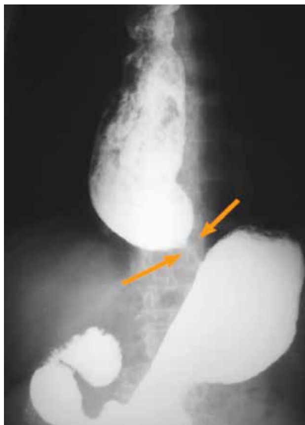
Figura 2. Tránsito digestivo superior (imagen típica en “pico de loro”).

Para su diagnóstico generalmente se realiza un tránsito digestivo superior, en el que es típico observar una dilatación esofágica con retención del contraste y un estrechamiento en su porción distal (“pico de loro”) (Fig. 2). Para su confirmación, puede realizarse una manometría esofágica, donde se observa un déficit en la relajación del EEI o incluso aumento de tono, asociado a aperistalsis del cuerpo esofágico (Fig. 3). Desde la introducción de la manometría de alta resolución se pueden determinar 3 tipos de acalasia (3,8) : tipo 1 o típica, con aperistalsis y relajación incompleta del EEI, tipo 2 aperistáltica con panpresurización y tipo 3, aperistáltica con espasmos del cuerpo esofágico y relajación anormal del EEI.