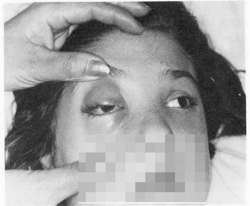
FIG. 2. Alteración de la movilización del ojo. Nótese cómo el ojo derecho es incapaz de seguir el movimiento combinado de levoversión (dirigir la mirada al lado izquierdo), entrando en divergencia secundaria