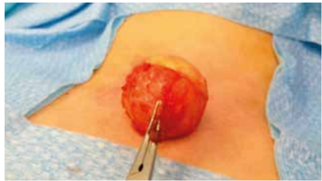
Figura 3. Quiste tímico supraesternal.

La hendidura cervical media es una anomalía que aparece en la cara ventral del cuello de forma excepcional. Su etiología es desconocida, aunque se considera que se produce a consecuencia de un fallo en la fusión de los arcos branquiales en línea media cervical. Se presenta como una lesión pediculada en su extremo superior, un tracto de piel atrófica y un seno cutáneo en el extremo inferior que acaba en fondo de saco y que contiene glándulas salivales. Puede presentarse