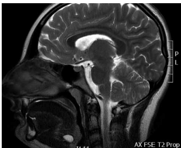
Figura 4. Imagen de RMN de quiste del conducto tirogloso.