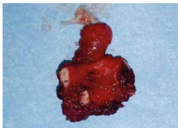
Figura 6. Pieza quirúrgica tras exéresis de quiste del conducto tirogloso por técnica de Sistrünk.

El diagnóstico diferencial de estas lesiones debe realizarse con: quistes dermoides, adenopatías, quistes sebáceos, quistes branquiales, nódulos tiroideos, lipomas y malformaciones linfáticas.