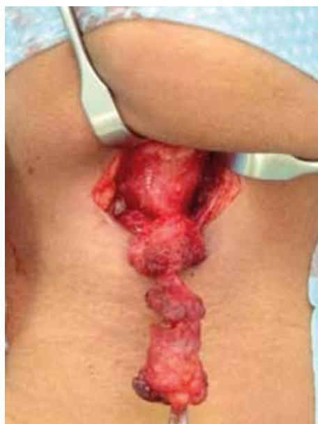
Figura 5. Imágenes intraoperatorias de la técnica de Sistrünk.

normalmente entre la 5ª y 8ª semanas de gestación dejando un remanente distal, el lóbulo piramidal, hasta en el 50% de la población. Si esta obliteración falla puede dar origen a un quiste del conducto tirogloso en cualquier punto a lo largo del trayecto (1,5,7) .