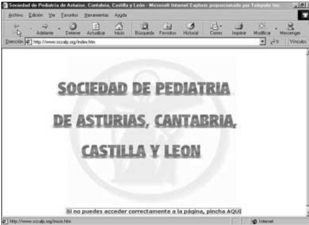
Figura 1. Página principal de la web de la SCCALP.

dato, o bien se desea cambiar de cuenta en la que cargar el recibo anual.